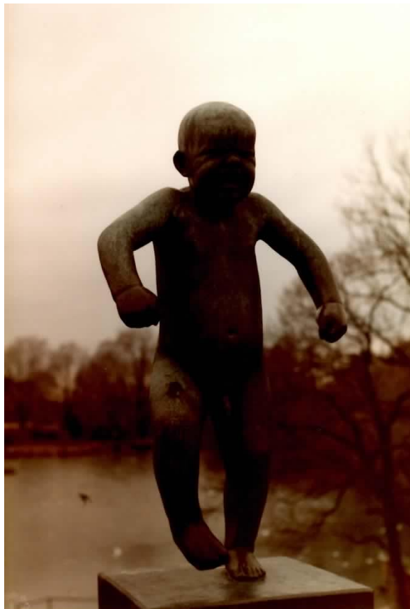
Illustration : Gustav Vigeland, Oslo ( Le bébé hurleur )

Organisée par le Laboratoire FoReLL (EA 3816) Equipe B1 « Poétiques de la représentation » Pôle A "Linguistique"